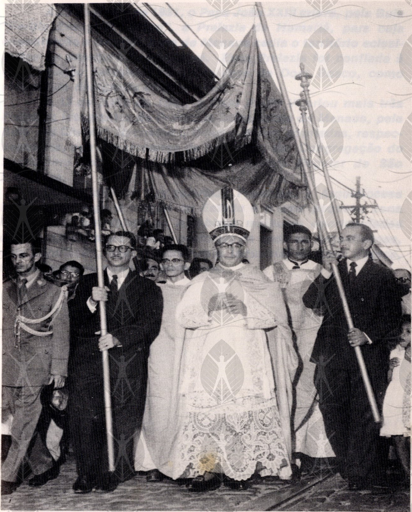
Dirigindo-se, acompanhado das mais altas autoridades do Amazonas, para tomar posse como Arcebispo de Manaus, na Igreja da Catedral.