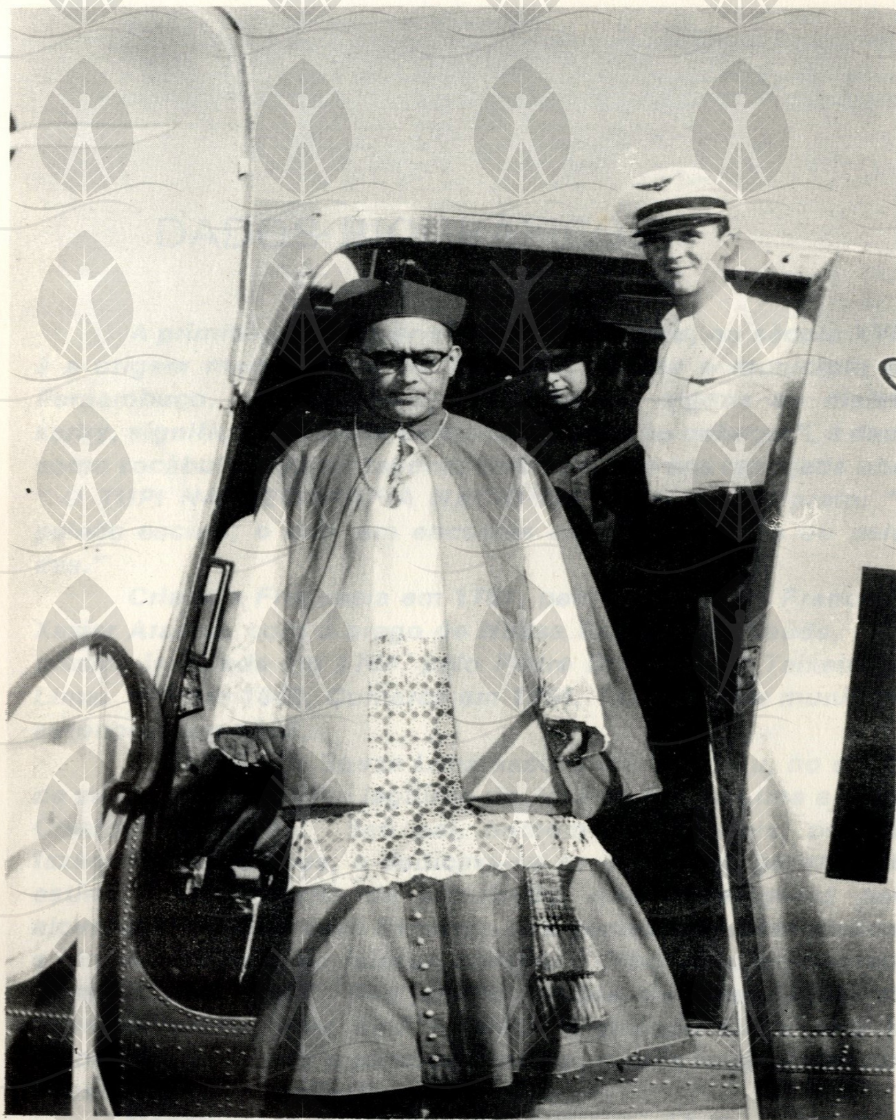
Dom João, quando pisava pela primeira vez o solo Amazonense, para tomar posse no Governo Arquidiocesano de Manaus aos 24 de Maio de 1958.