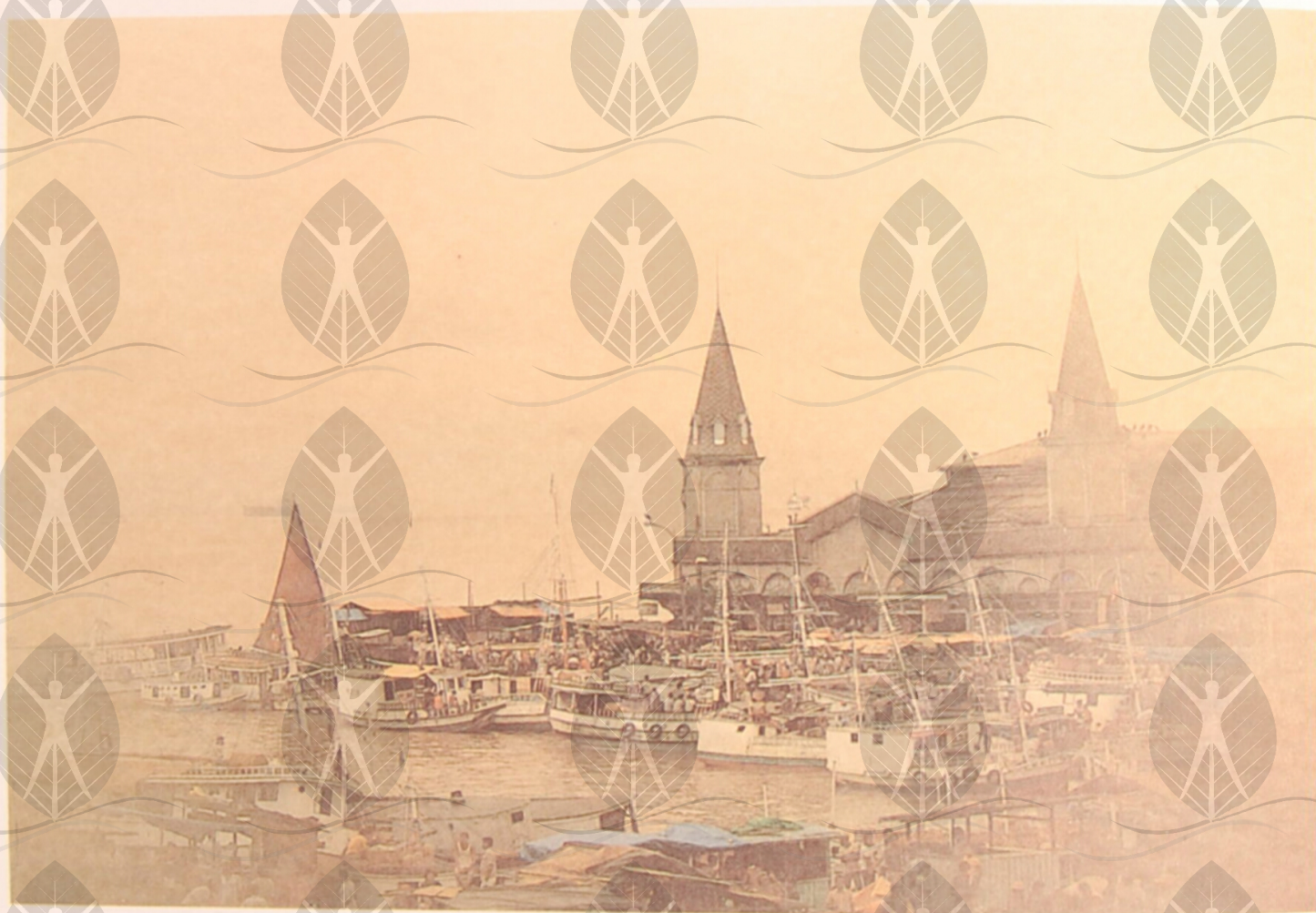
Mercado Ver-o-Peso, Manaus Ver-o-Peso Market, Manaus