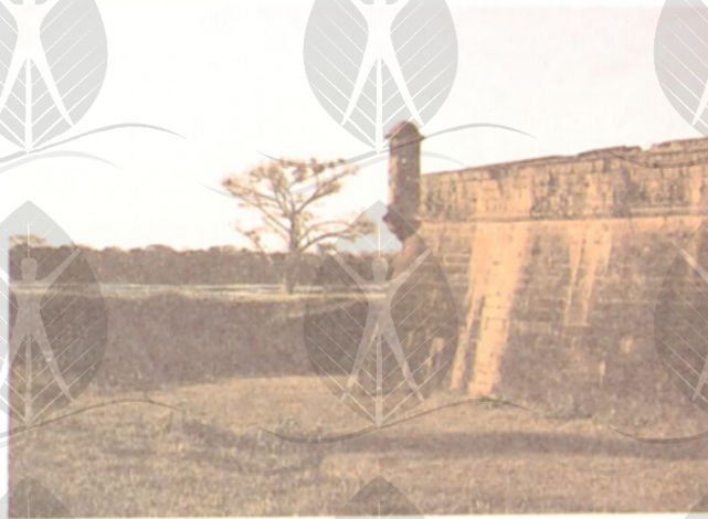
Forte Príncipe da Beira Fort Príncipe da Beira

This book represents more than an edition to commemorate the bicentennial of the expedition of Alexandre Rodrigues Ferreira over the rivers and lands of the Amazon. It is part of a task begun five years ago