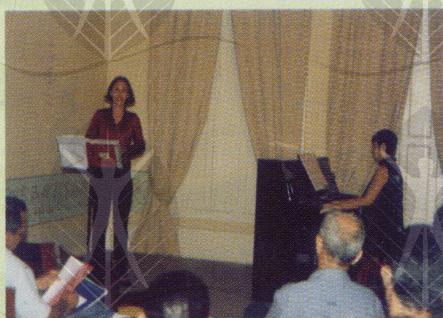
Sala de Concertos Carlota Ribeiro