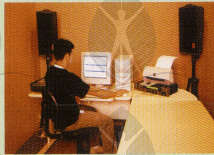
Estúdio de Gravação

"A juventude é uma das nossas maiores preocupações. Terá atenção especial com o fomento do esporte, espaços culturais e educacionais que possam assegurar a formação de gerações saudáveis e preparadas a vencer os desafios de um mundo globalizado e competitivo, proporcionando um futuro melhor para as nossas próximas gerações..."